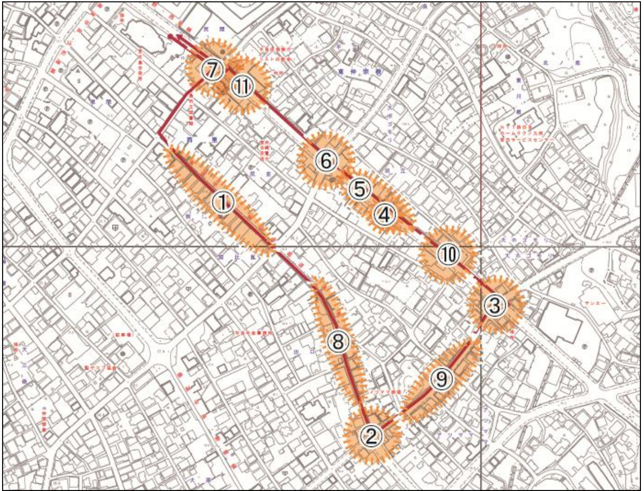
図 宮古島市役所⇔東里交差点ルート点検位置図